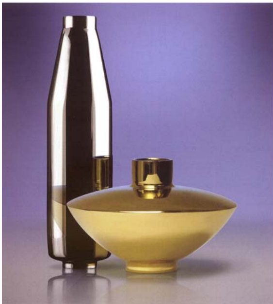
Er zijn verschillende water- en lucht vitalisers, elk gebaseerd op andere vibrations.

De vitaliser, een gelegerde buis van staal en zink is, kan aan een kraan of tussen de waterleiding worden geplaatst. Het zuivert het water niet alleen van negatieve sporen, het brengt ook de juiste trillingen terug in het water. Al het leven is energie en andersom: energie is leven. Ieder voorwerp of substantie en elke levensvorm heeft een energie met een eigen trilling. Ook vaste vormen zoals het menselijk lichaam en zelfs stenen bestaan uit trillingen, zijn trillingen. Alle levende vormen communiceren met elkaar via trillingen: trillingen kunnen worden opgepakt en doorgegeven.