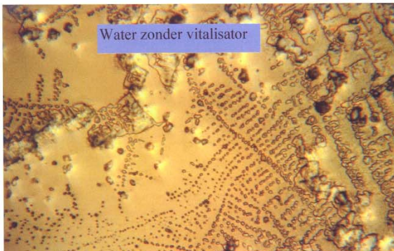
Zo ziet water eruit dat niet gevitalseerd is.

Als je een druppel water onder een microscoop legt, geeft dit haakse structuren te zien. Vitaal water heeft een natuurlijke structuur, zoals de nerven van een varen: